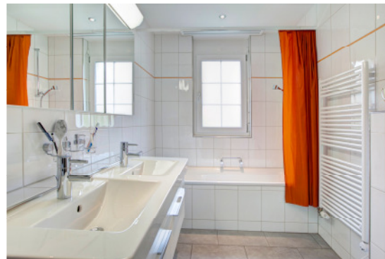
Helles modernes Badezimmer